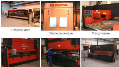
Découpe laser Cabine de peinture Poinçonneuse Presse plieuse Presse plieuse Cisaille

Una planta de fabricación semiautomatizada de última generación. Contamos con el equipo necesario para todo el proceso de fabricación, con modernas máquinas herramienta que nos permiten realizar trabajos de calidad, asegurar grandes cantidades de pedidos con perfectos acabados de nuestros productos.